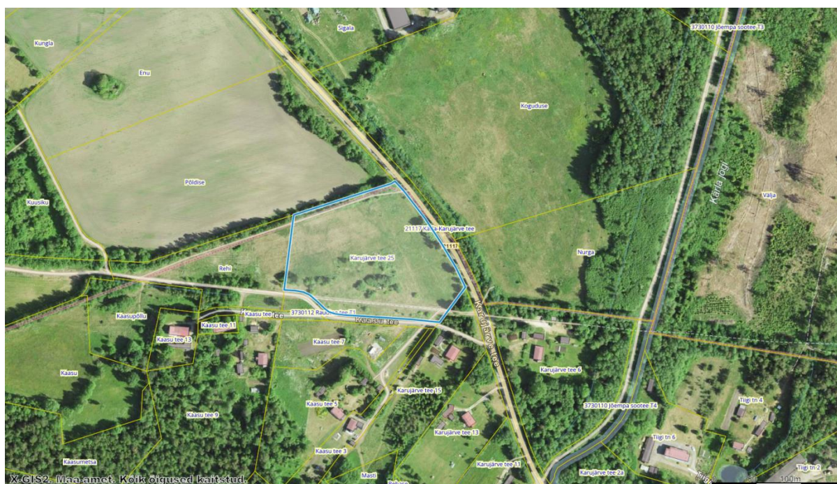
Joonis 1. Planeeringuala asendiskeem (Alus: Maa-ameti X-Gis kaardiserver)

Planeeringuala piirneb põhja suunal Põldise (katastritunnus 37301:002:0499, kinnistu nr 3585934, sihtotstarve 100% maatulundusmaa), lõuna suunal Karujärve tee 15 (katastritunnus 37301:001:0906, kinnistu nr 70034, sihtotstarve 100% maatulundusmaa) ja 3730112 Raudtee tee T1 (katastritunnus 71401:001:0347, kinnistu nr 11445450, sihtotstarve 100% transpordimaa), ida suunal 21117 Kärla-Karujärve tee (katastritunnus 37301:002:0426, kinnistu nr 13693550, sihtotstarve 100% transpordimaa) ning lääne suunal Rehi (katastritunnus 37301:002:0010, registriosa nr 1362334, sihtotstarve 100% maatulundusmaa) katastriüksusega.